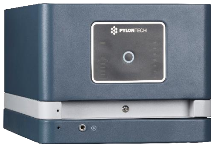
ESS Battery Main Controller