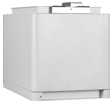
ESS Battery Module 3.55kWh