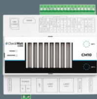
Checkwatt CM10 Art nr: 303002