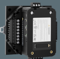
Pixii Home Frekvenskit FCR/FFR (acuvim & trafo)