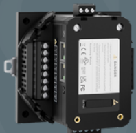
Pixii Home Frekvenskit FCR/FFR (acuvim & trafo)