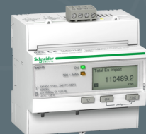
Schneider iEM 3155 KWH MÄTARE 63A M Art nr: 304230