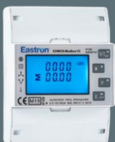
Smartmeter för solväxleriktare för att begränsa solproduktion vid max inmatning överskott.