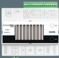
Checkwatt CM10 Art nr: 303002