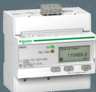
Schneider iEM 3155 KWH MÄTARE 63A M Art nr: 304230