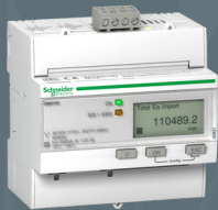
Schneider iEM 3155 KWH MÄTARE 63A M Art nr: 304230