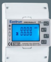
Smartmeter för solväxleriktare för att begränsa solproduktion vid max inmatning överskott.